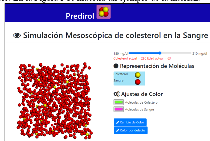
Figura 3. Interfaz para la Simulación mesoscópica.

En el modelo de simulación mesoscópica se mostrará el nivel de concentración de colesterol que tenga actualmente el paciente y podrá observar el crecimiento en el modelo con la barra de control del sistema, también puede cambiarle el color a las moléculas de dicho modelo. En la Figura 3 se muestra un ejemplo de la interfaz.