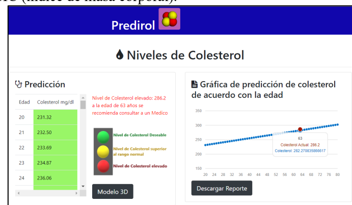
Figura 2. Predicción de colesterol.

Maestría en Sistemas Computacionales El sistema, denominado Predirol permite a los usuarios ingresar la concentración de colesterol de sus análisis para obtener la predicción de acuerdo con la edad con una regresión logística, se muestra dicha predicción en una gráfica y en una tabla como se muestra en la Figura 2. Si el paciente tiene un nivel de colesterol en un rango normal, se representará de color verde, si el nivel de colesterol es elevado al rango normal se representará de color amarillo y si el nivel de colesterol es demasiado alto se representará de color rojo. En caso de que el usuario no tenga análisis de concentración de colesterol, solo se le mostrará la predicción de acuerdo con la edad, proporcionando su IMC (índice de masa corporal).