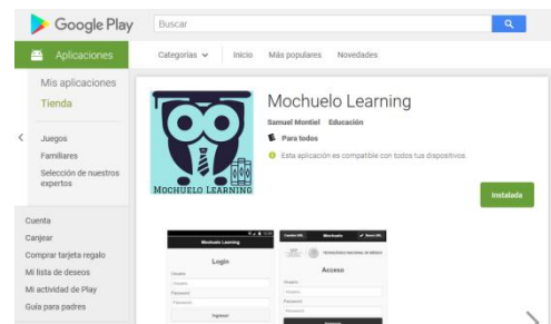
Fig. 2 Aplicación Mochuelo.

La imagen mostrada en la Fig. 2 exhibe la aplicación Mochuelo Learning disponible en la tienda de aplicaciones de la Google Play la cual es instalable en cualquier dispositivo Android y permite la realización de evaluaciones a través de ella, obteniendo retroalimentación con cada examen resuelto y cuenta con una sección de gráficas que permiten visualizar promedios generales y específicos de las materias que lleve cierto discente. La aplicación fue construida mediante HTML, CSS y JavaScript y empaquetada utilizando el marco de trabajo PhoneGap. De igual forma la plataforma Web es importante debido a que la creación de cursos, preguntas y evaluaciones se hace por dicho medio. Logrando con esto una aplicación sólida que cuenta con plataforma Web y móvil.